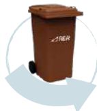
Depozitați-le în recipientul corespunzător