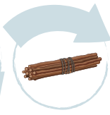
Mărunțiți / legați