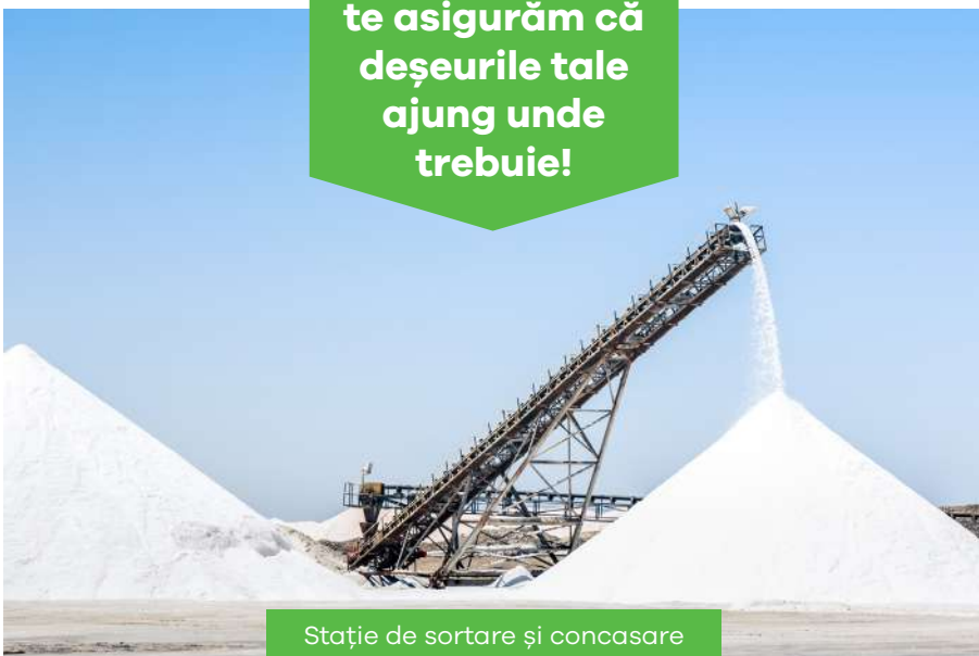
Stație de sortare și concasare

Noi, RER SUD, te asigurăm că deșeurile tale ajung unde trebuie!